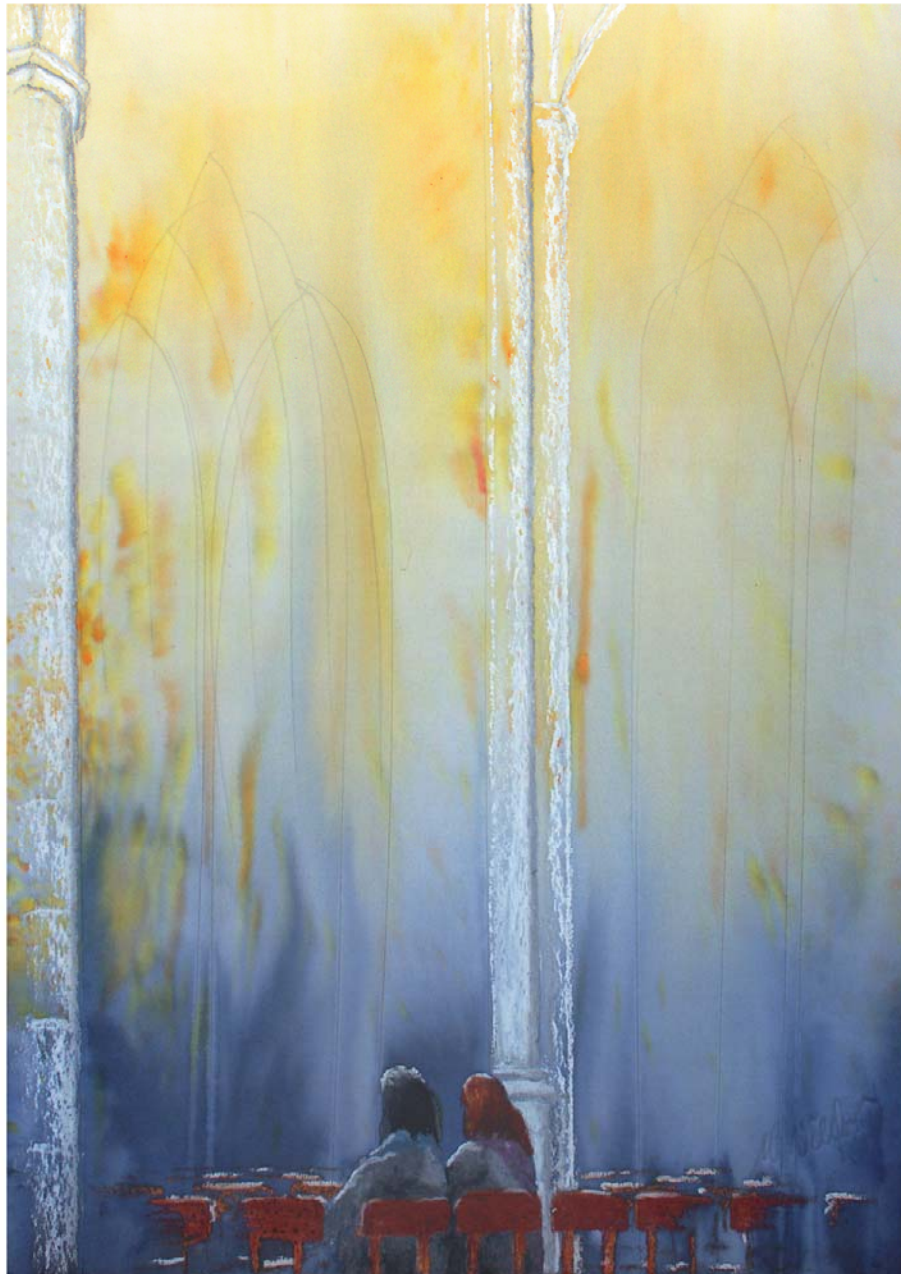
Bild: spirituelle Kunst von Michael Willfort, Galerie: www.kunst2day.de

Wo es finster bestellt ist in uns selbst, in der Kirche und in dieser Welt, sehnen wir uns nach dem Licht. Wo alles verhärtet ist in Hass und Kälte, sehnen wir uns nach Liebe und Wärme. Wir brauchen Gottes Geist in uns selbst, in der Kirche, in der Welt. Wir brauchen Pfingsten.